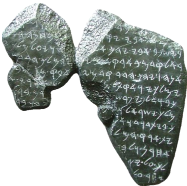
Fragment Tel Dan