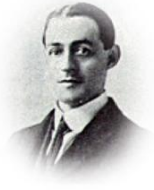
Arthur W. Pink 1886-1952